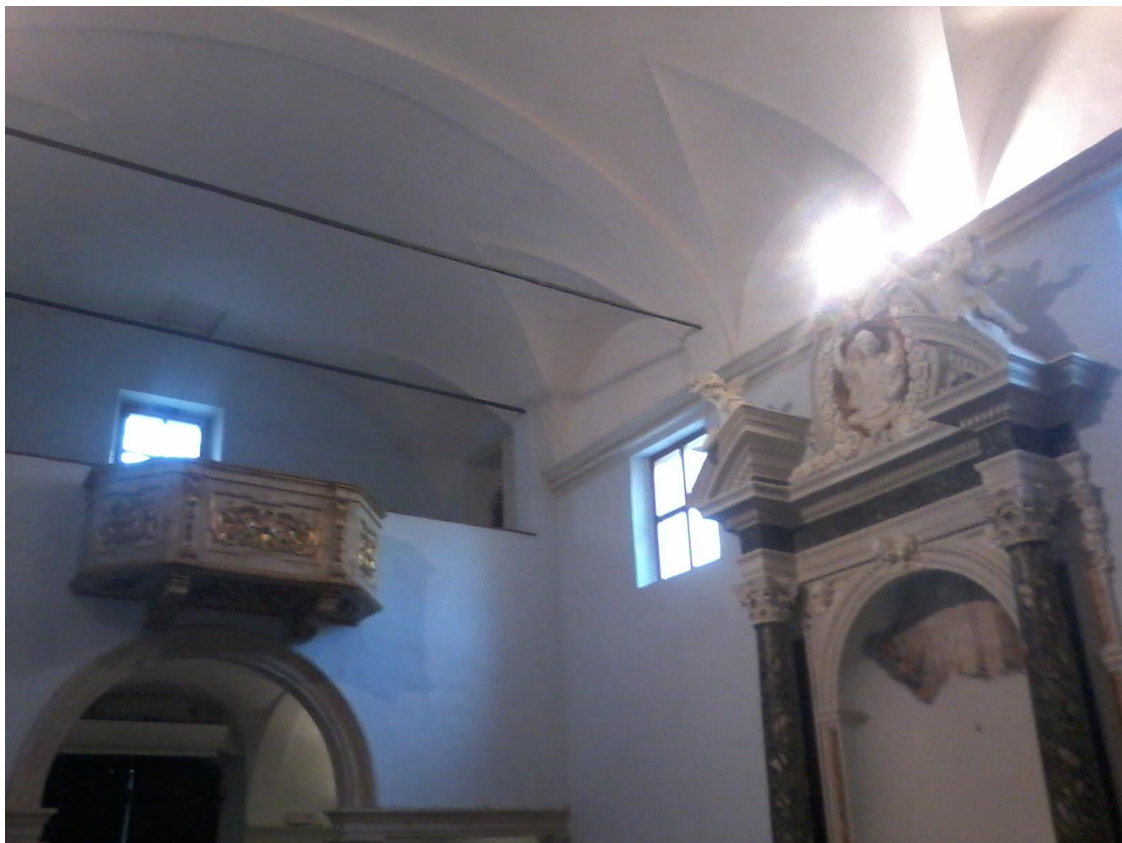
Soffitto con tiranti di ferro (da cui è possibile far calare elementi non eccessivamente pesanti)