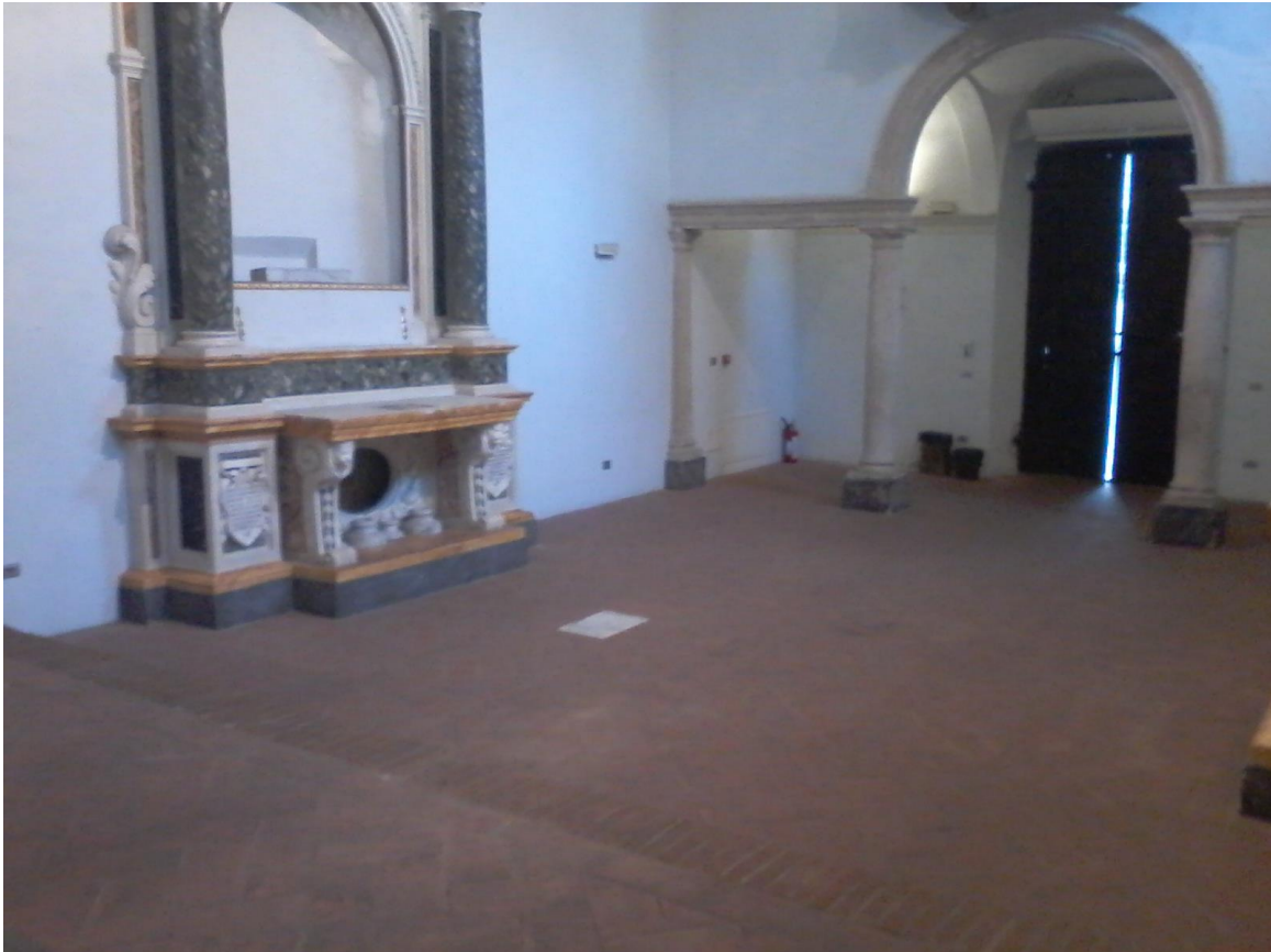
Ingresso e altare laterale